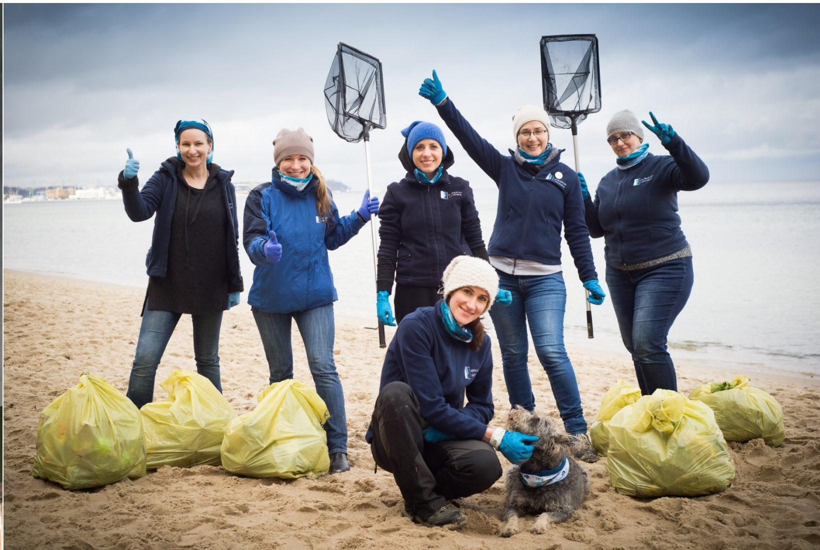
Projekt Save the Sea – Fundacja Rozwoju Akwarium Gdynskiego