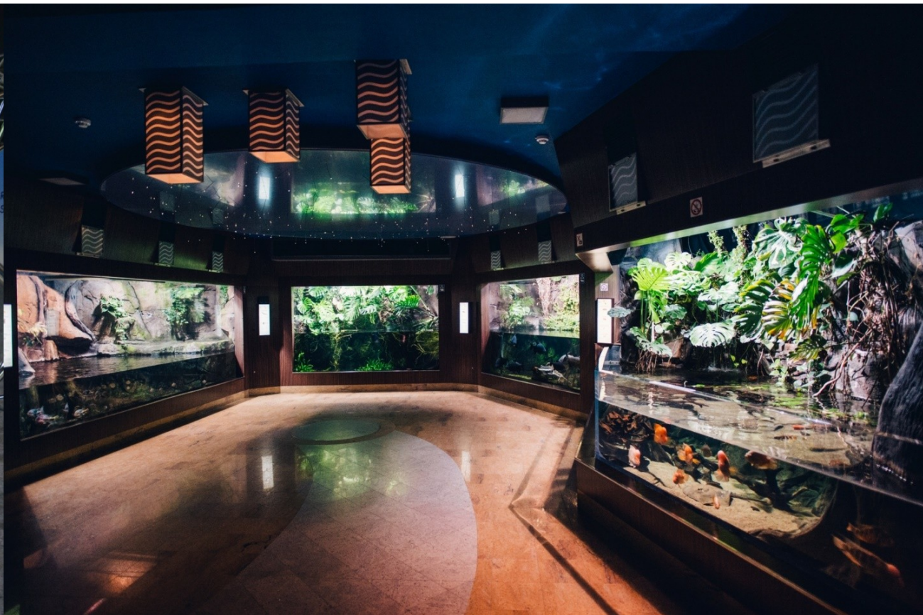
Edukacja przyrodnicza w Akwarium Gdyńskim MIR-PIB – bioróżnorodność wystawy stałej