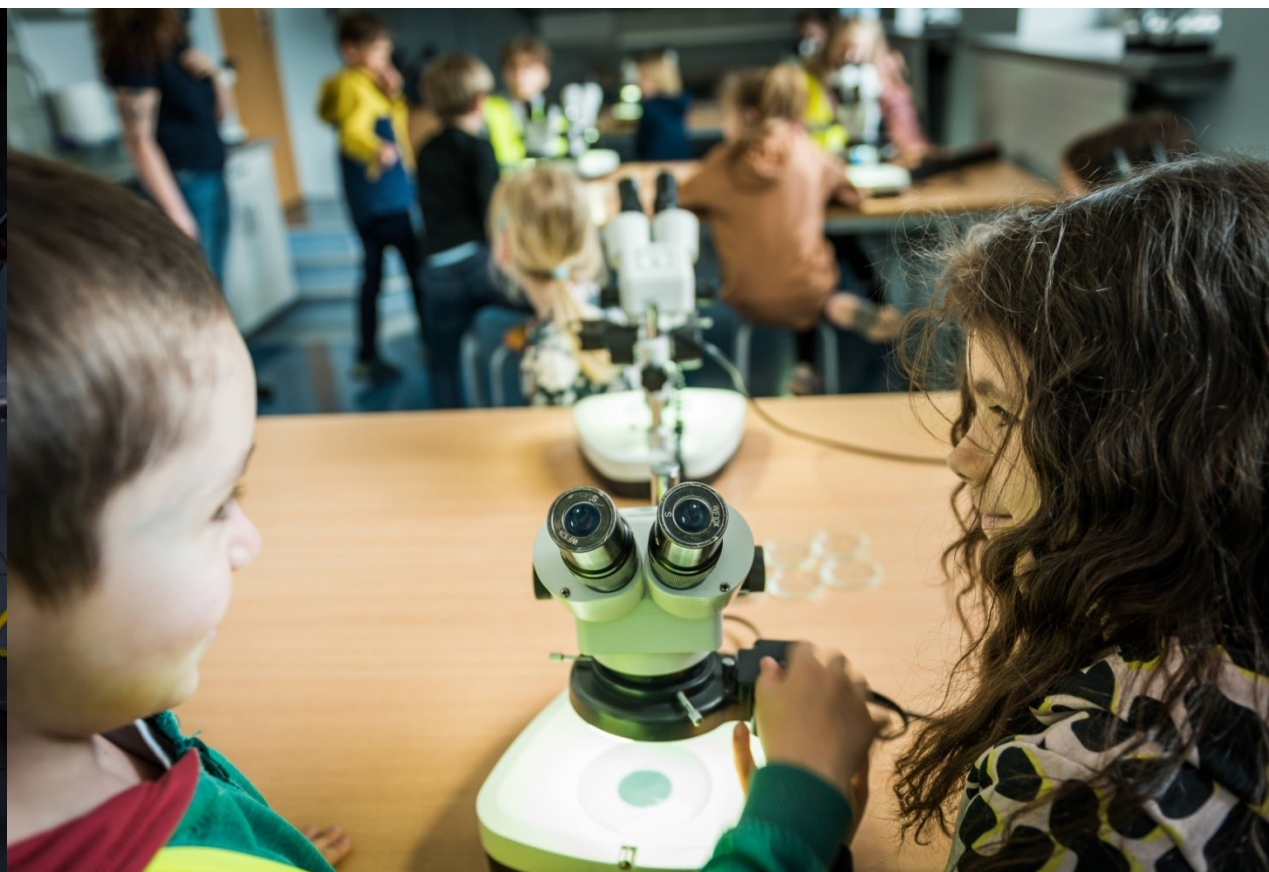
Edukacja przyrodnicza w Akwarium Gdyńskim MIR-PIB – grupy odbiorców