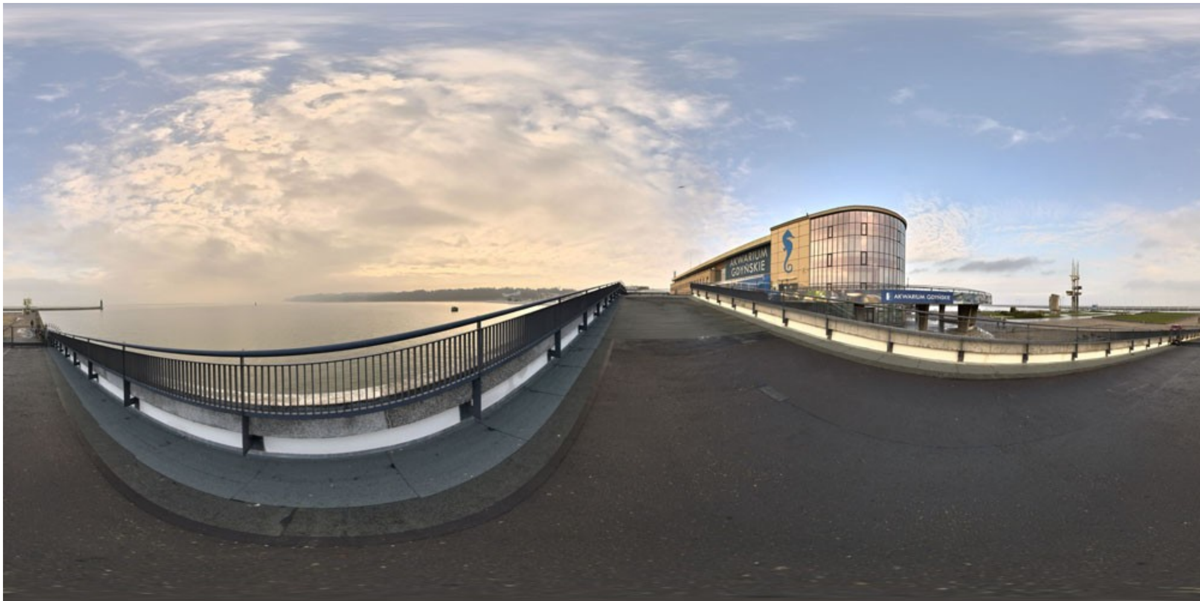
Akwarium Gdynskie MIR-PIB pełni funkcję dydaktyczno – hodowlaną.