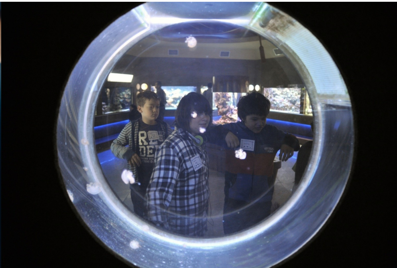
Edukacja nieformalna – Klub Młodego Odkrywcy Mórz