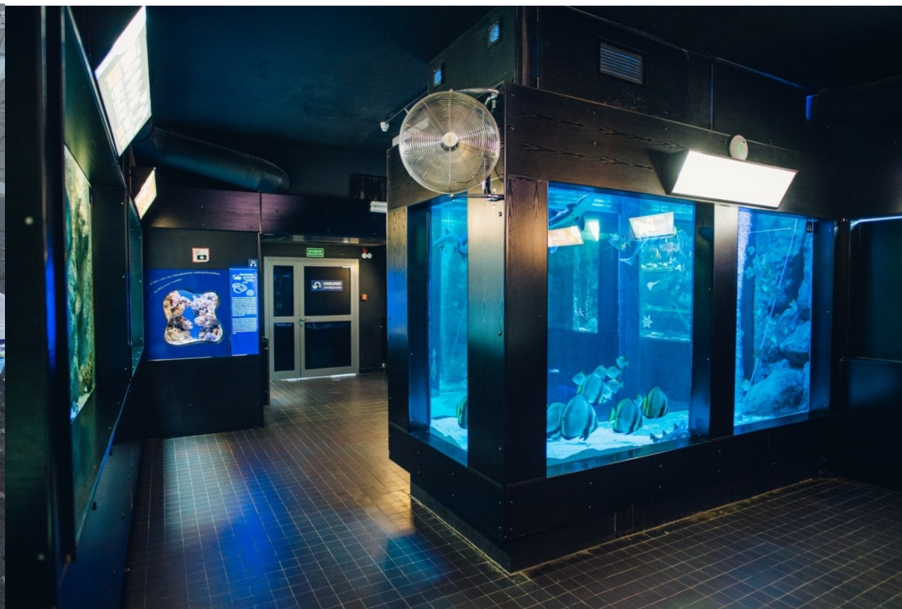
Edukacja przyrodnicza w Akwarium Gdyńskim MIR-PIB – bioróżnorodność wystawy stałej